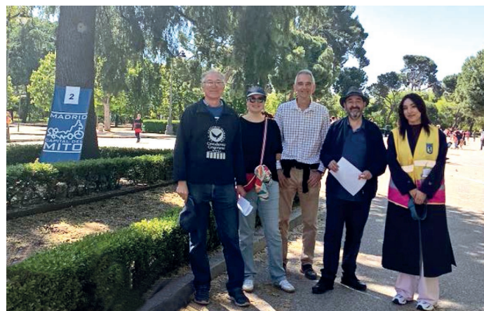
Socios y miembros de la junta directiva de la Delegación de Madrid de la SEEC colaborando en la gymkhana mitológica «Madrid, Capital del Mito» en su edición de 2025