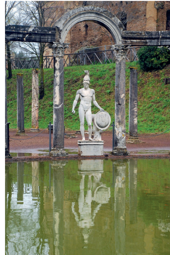
Villa Adriana (Tívoli)

SOCIEDAD ESPAÑOLA DE ESTUDIOS CLÁSICOS DELEGACIÓN DE MADRID