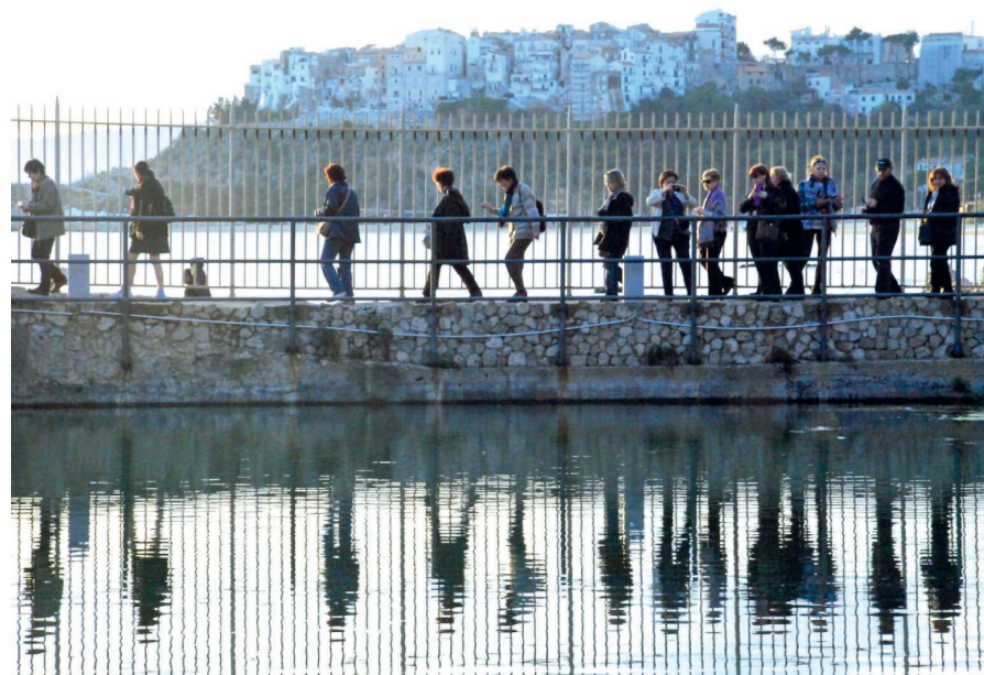
Socios de la SEEC en el Antro di Tiberio (2013)

Los Trabajos de Fin de Grado que aspiren al premio tienen que haber sido leídos entre el 1 de enero de 2025 y el 31 de diciembre de 2025. Asimismo, tienen que haber obtenido una calificación mínima de Sobresaliente. Dicha calificación se acreditará mediante un certificado de notas que se aportará