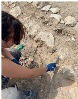
Participante de las excavaciones de Confloenta 2024

Los requisitos para la selección de los candidatos serán publicados y difundidos en la página Web de la Delegación de Madrid: www.seecmad.es