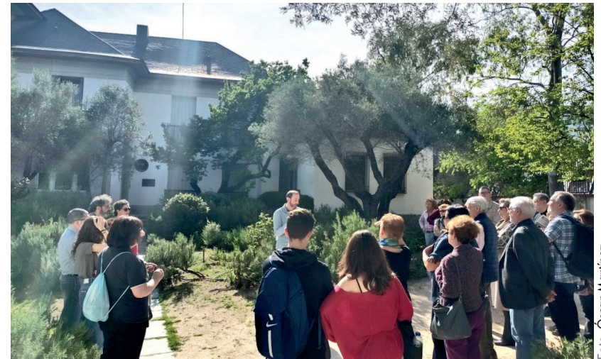
Visita a la Fundación Ramón Menéndez Pidal en abril de 2025

La fecha y el lugar del acto de entrega de los premios correspondientes a la convocatoria 2025/2026 serán convenientemente anunciados a los interesados.