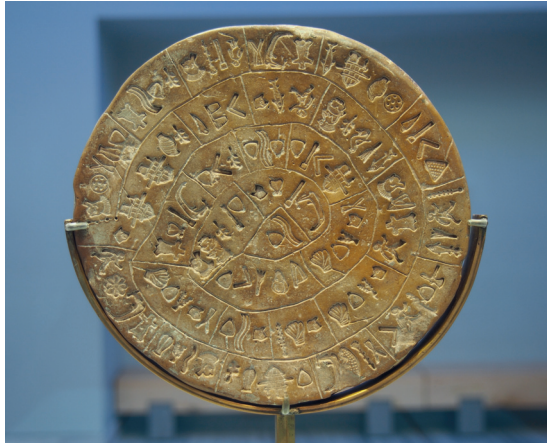
Disco de Festo