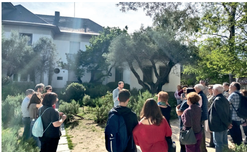
Visita a la Fundación Ramón Menéndez Pidal en abril de 2025

La fecha y el lugar del acto de entrega de los premios correspondientes a la convocatoria 2025/2026 serán convenientemente anunciados a los interesados.