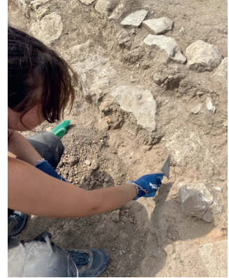
Participante de las excavaciones de Confloenta 2024

Los requisitos para la selección de los candidatos serán publicados y difundidos en la página Web de la Delegación de Madrid: www.seecmad.es