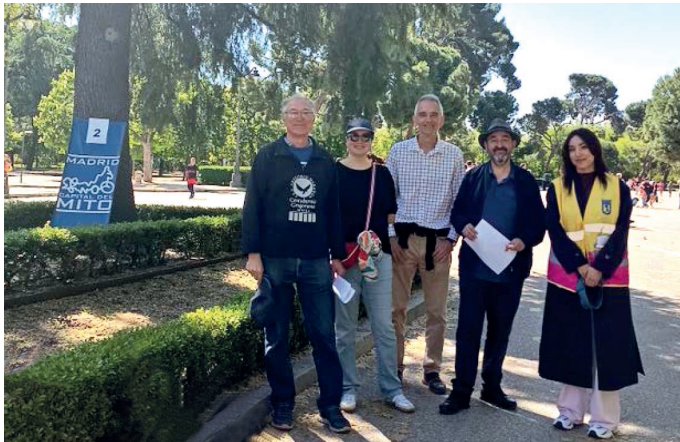
Socios y miembros de la junta directiva de la Delegación de Madrid de la SEEC colaborando en la gymkhana mitológica «Madrid, Capital del Mito» en su edición de 2025