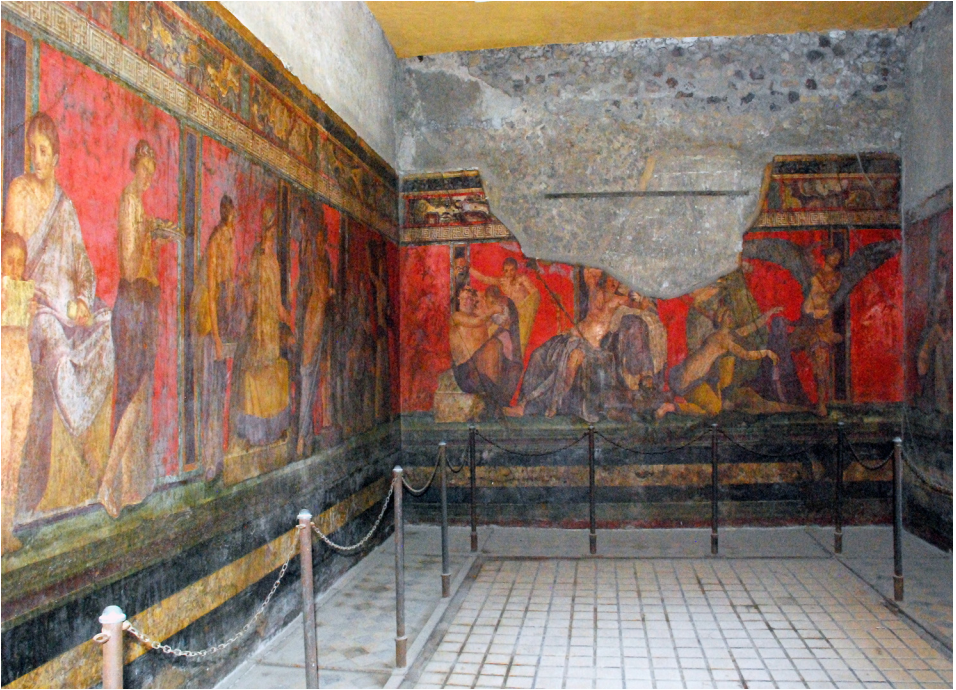
Villa de los Misterios (Pompeya)

SOCIEDAD ESPAÑOLA DE ESTUDIOS CLÁSICOS DELEGACIÓN DE MADRID