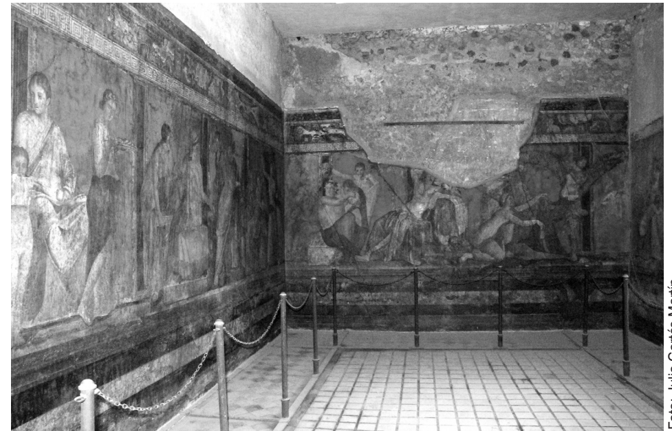
Villa de los Misterios (Pompeya)

Más información en: Sociedad Española de Estudios Clásicos Delegación de Madrid c/ Serrano 107, Madrid 28006 Tfno. 91 564 25 38 Fax: 91 564 56 16 www.seecmadrid.es e-mail: seecmadrid@gmail.com https://www.facebook.com/seecmadrid/ Twitter: @seecmadrid