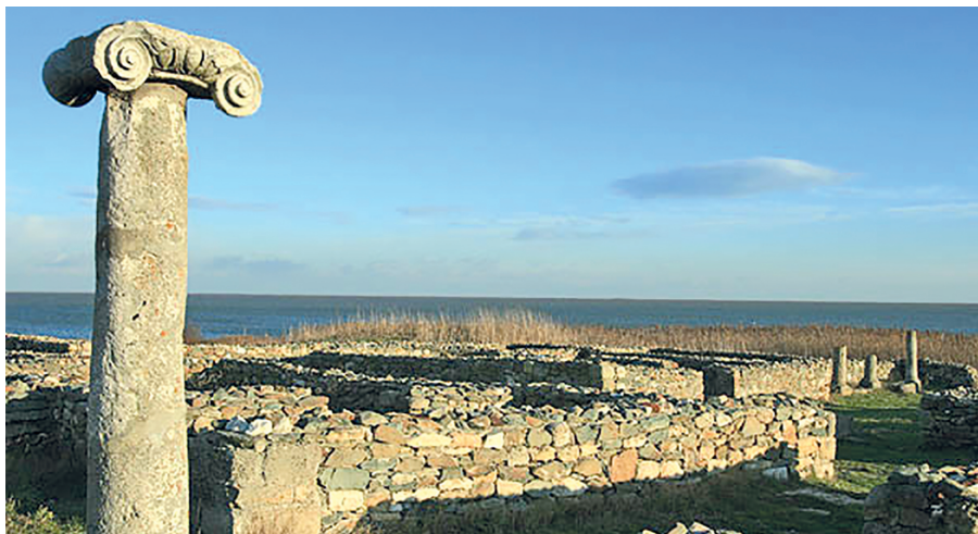
Colonia griega de Istro; delta del Danubio.

país vecino: la Lusitania atravesada por el flumen Durius . En este viaje de cinco días visitaremos Oporto, cuyo centro histórico es patrimonio de la UNESCO, y Coimbra, noble población por sus restos romanos y su famosa Universidad, que se cuenta entre las más antiguas y prestigiosas de Europa. Además, completaremos la ruta de cinco días viendo Aveiro, la Venecia portuguesa, y Guarda, rica en historia y gastronomía, y tendremos tiempo para recuperar fuerzas entre fados, la visita a una bodega y las aguas termales de Luso, situada en el paraje encantado de la sierra de Buçaco.