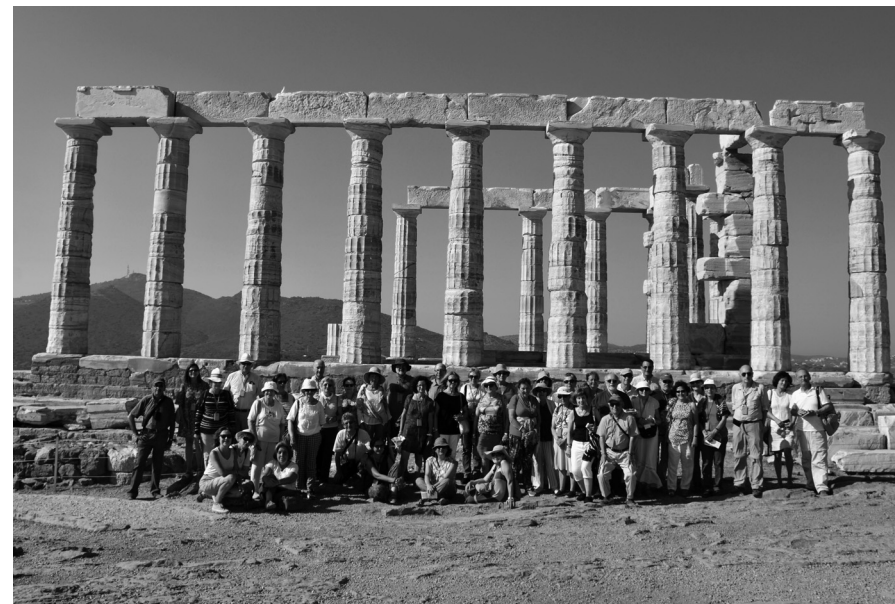
Viajeros de la Delegación de Madrid (Cabo Sunio, 2016)